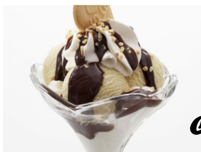
Coupe Dänemark € 5,50