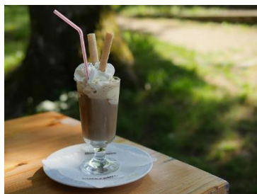
Eiskaffee € 4,80 gerührt oder ungerührt