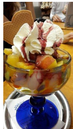
Früchtebecher € 7,00 mit Früchten der Saison