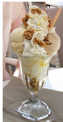
Nuss mit Schuss € 7,50 Nussbecher € 5,80