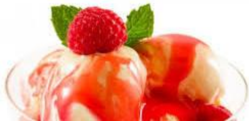
Heiße Liebe € 5,80 vanilleeis mit heißen Himbeeren